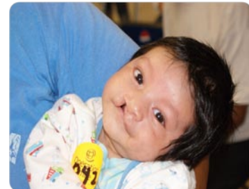
201 pacientes fueron evaluados en total