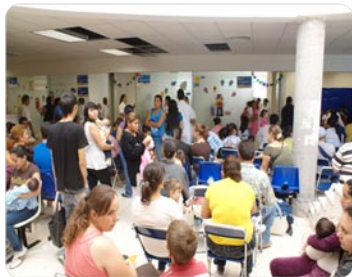
La evaluación se llevó a cabo en una área anexa del IJCR