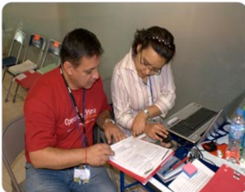
Fue una árdua tarea que realizaron tanto voluntarios médicos como no médicos.